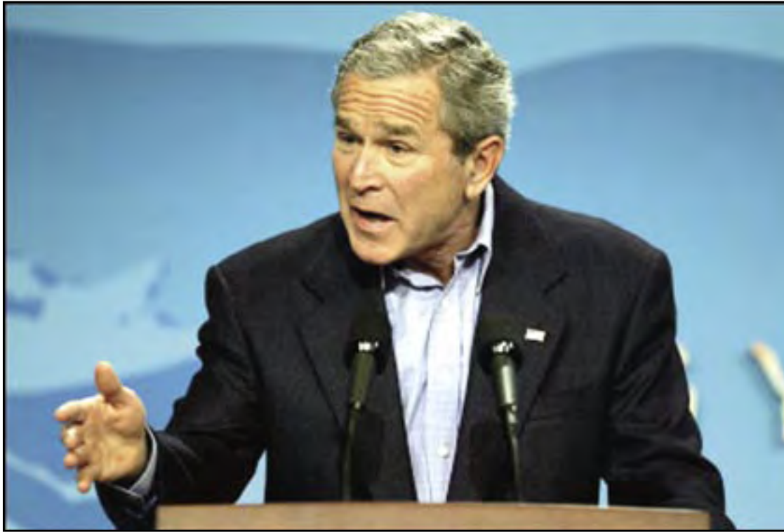
Presidente di Estados Unidos, George W. Bush.

WASHINGTON — E disconformidad cu ocupacion di Estados Unidos na Iraq, a lanta un cantidad creciente di Mericano pa opina cu nan pais mester ocupa di su propio asunto enbes di mescla su